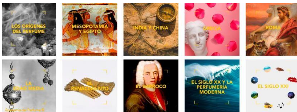
Imagen del recorrido por diferentes épocas de la Historia del Perfume que se pueden encontrar en la web de la Academia

Tras el encuentro del 27 de mayo, tuvo lugar la primera reunión de Académicos para elegir el ganador en la categoría Icónico y validar el premio a la Sostenibilidad e Innovación. En los próximos días se convocará el Jurado de la Prensa para el open day que tendrá lugar a finales de junio y, en julio, tendrá lugar la reunión del Jurado de Arte y Cultura, con representantes de diferentes disciplinas artísticas. Todo un exhaustivo proceso participación de diferentes expertos del perfume para llegar a los mejores perfumes del año, que se darán a conocer en una gala muy especial y más emotiva que nunca, previsiblemente el 7 de octubre. Será una ceremonia en la que arte y perfume se darán de nuevo la mano con una actuación que pretende ser el símbolo de la recuperación y del valor del perfume en las vidas de millones de personas.