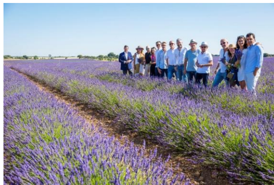
Académicos y patronos de la Fundación Academia del Perfume posan en medio de los campos de lavanda de Brihuega

En noviembre de 2017, en un acto celebrado en la Real Academia de Bellas Artes de San Fernando, la Academia del Perfume nombró a sus primeros 12 Académicos (7 de Número, 3 de Mérito y 2 de Honor), convirtiéndose así en la primera academia del perfume del mundo con académicos en su seno. La unión de todo ese talento bajo el paraguas de la Academia abre a la institución un nuevo horizonte de posibilidades inimaginables para promover la cultura del Perfume en España.